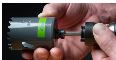
2. Enkle å bytte. Trekk holderen bakover og slipp når hullsagen er på plass.