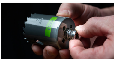
1. Monter på medfølgende adapter.